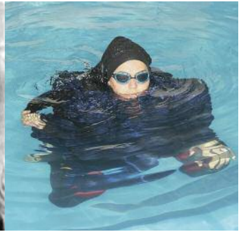
et après la révolution islamique.