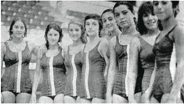
Nageuses Iraniennes avant ...