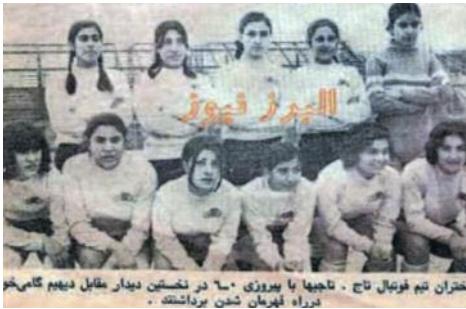
Footballeuses Iraniennes avant...