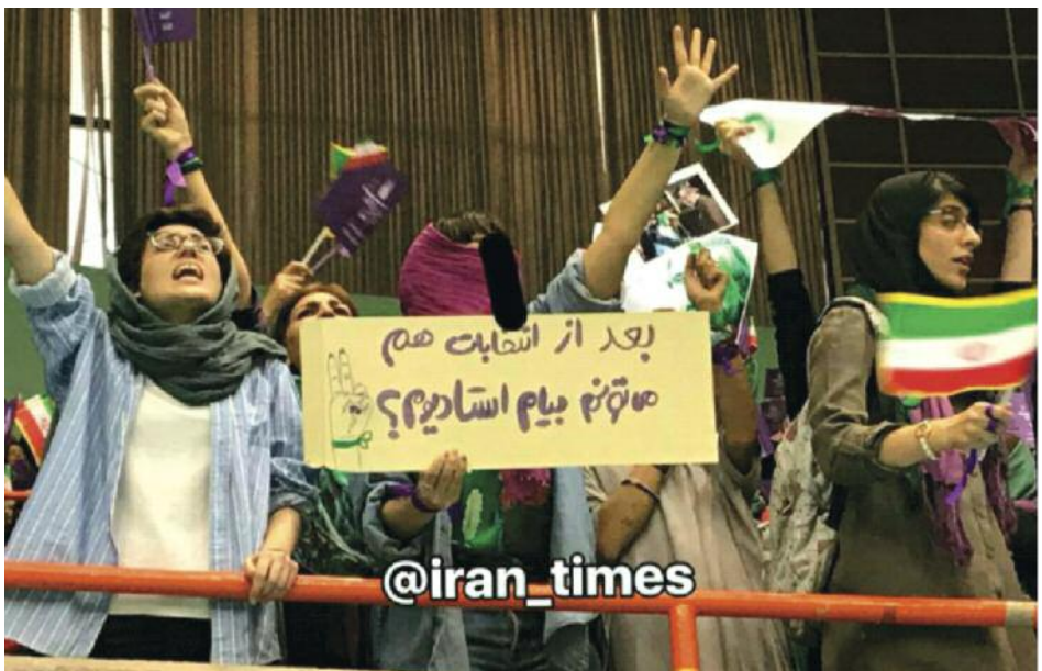
Lors d'un meeting politique dans un stade, des Iraniennes réclament le droit d'assister à des matchs : " MÊME APRÈS LES ÉLECTIONS JE VIENDRAI AU STADE "

L'Arabie Saoudite vient de lever l'interdiction pour les femmes d'entrer dans les stades. L'Iran n'a cédé que dans quelques cas, toujours sous la pression internationale - et continue d'interdire aux femmes l'entrée des stades.