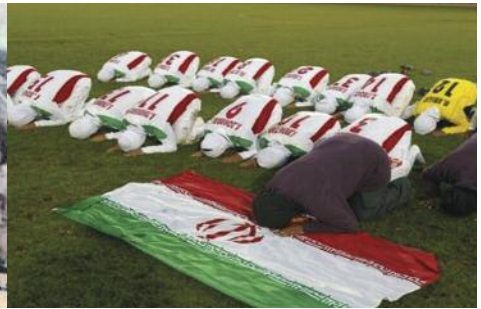
et après la révolution islamique.