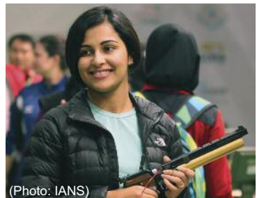
New Delhi: Heena Sidhu during 10m air pistol event at the Asian Olympic Qualifying Tournament in New Delhi, on Jan 27, 2016.

● Heena Sidhu, l'Indienne médaillée d'or de tir à air comprimé, boycotte les championnats asiatiques de Téhéran : " Obliger une sportive à porter le hijab est contraire à l'esprit du sport" (WITW, 10.31.2016)