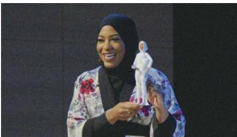
L'escrimeuse Ibtihaj Muhammad, modèle de la poupée Barbie de Mattel

● Mattel commercialise une poupée Barbie sur le modèle de la première escrimeuse américaine voilée à participer aux JO afin qu'elle « continue d'inspirer partout les femmes et les jeunes filles pour qu'elles repoussent les barrières ! »